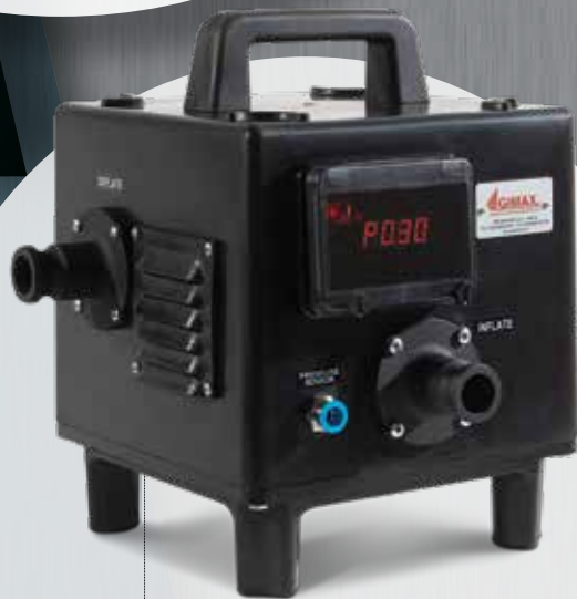
■ Tragbares Druckluftgebäuse Gonfleur portable

LE CAOUTCHOUC BUTYLIQUE est le matériau qui caractérise les tableaux électriques réalisés par Gimax. En effet, l'entreprise a toujours été orientée vers la recherche des normes de qualité les plus élevées et est devenue, dès les années 90, une véritable pionnière dans l'utilisation de ce matériau. Dès le début de son